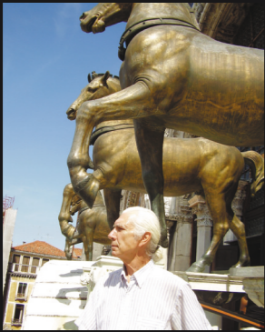
De schrijver in Venetië